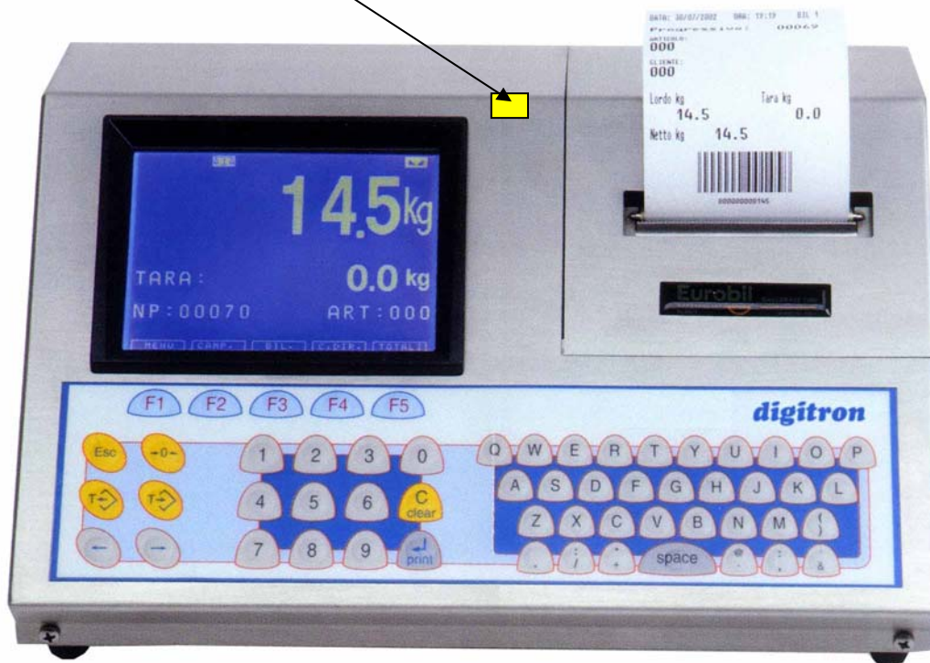
Slika 5 Ovjerni žig u obliku naljepnice